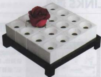
这个玫瑰花坛让“插花”有了新方法

瓷器品牌 Spin Ceramics 推出了一款“青白釉十六格玫瑰花坛”，让人能把情人节收到的玫瑰装起来。Spin Ceramics 的设计师将现代设计理念融入陶瓷制作中，让作品整体上简单大方，细节上别有韵味。比如这个玫瑰花坛，看上去四四方方，但细致到给每朵花单独设计了装水的小空间，花朵之间的位置刚好足够容纳每朵盛开的花苞。真正融入日常生活的设计不能太特立独行，而是要顾及及使用体验，Spin Ceramics 正好满足了这样的需求：放在桌上不会是最抢眼的视线焦点，但兼具美观与实用性，是可以长期放在桌子上的绝佳装饰。