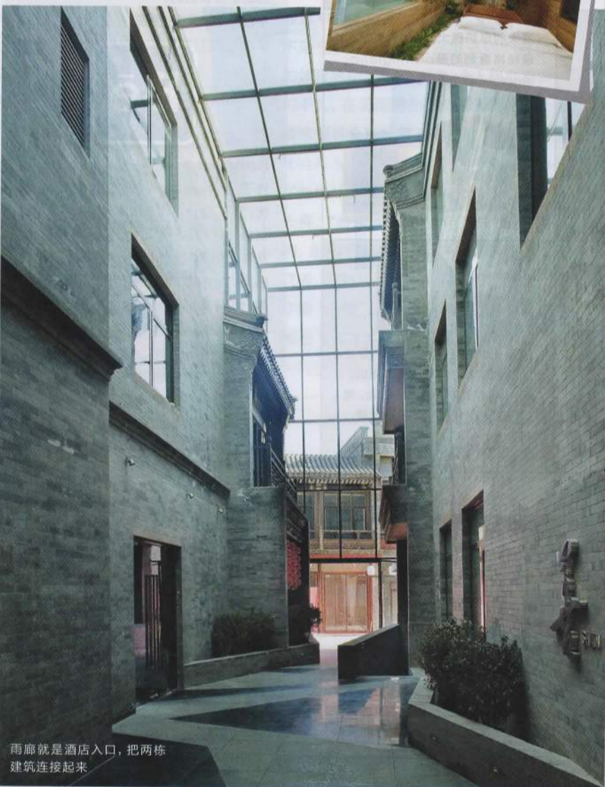
雨廊就是酒店入口，把两栋建筑连接起来