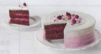
名为“真爱”的蛋糕拥有层次丰富的甜蜜口感

蛋糕用天然树莓粉勾勒出渐变色的表层，内部用61%黑巧克力烘焙成戚风蛋糕，吸收了用伊朗玫瑰提炼的天然凝露，将蛋糕送到唇边，淡雅的玫瑰花香会从微苦的黑巧克力中透出来，一口咬下去就能尝到夹层里藏着的法国树莓熬制的果酱。蛋糕外表的娇羞红晕，搭配口感上的莓果香和玫瑰香，让人能通过蛋糕感受爱情的甜蜜。